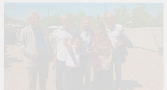
CONFERENZA Una vetrina del settore