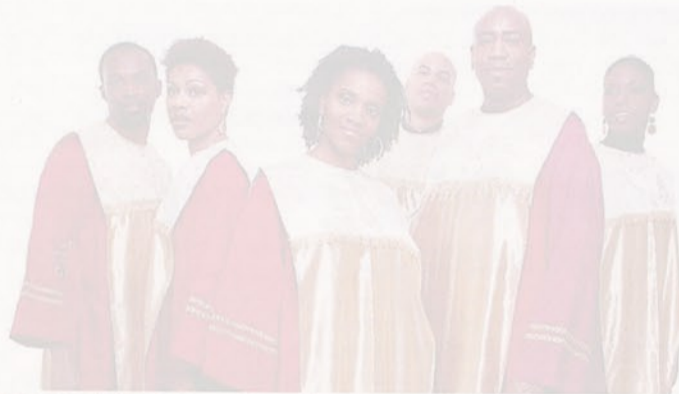
FASANOMUSICA Domani sera il concerto dei Black Harmony

Il repertorio dei Black Harmony include brani appartenenti alla tradizione gospel («Amazing Grace», «Oh Happy Day», «When the Saints», «Amen», «Kum ba ya») ed incursioni nel repertorio blues, jazz e soul, che permangono quale retaggio della formazione musicale dei diversi membri del gruppo. Lo stile della formazione musicale subisce inoltre l'influenza delle atmosfere esotiche e dei ritmi tipici del Paese d'origine, le Antille: a conferma di ciò il repertorio dei Black Harmony include anche brani in lingua creola. Ritornando al gospel, questo stile musicale è spesso