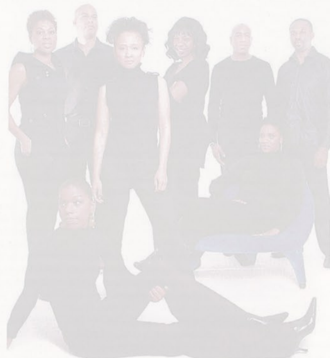
NON SOLO GOSPEL | Black Harmony proporranno un ampio repertorio

presente alla manifestazione. Da allora il gruppo ha intrapreso un fitto calendario di concerti in tutta Europa, costruendo nel giro di pochissimi anni una brillante carriera costellata di successi.