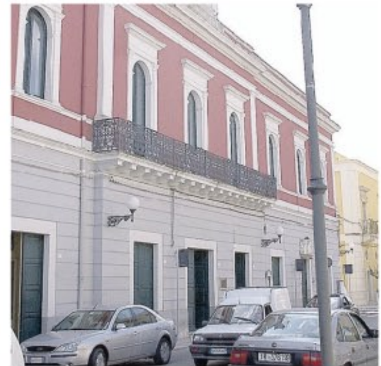
INCONTRO Accanto, il palazzo del municipio. Sotto, la copertina del libro di Agostino Picco

Questa sera, alle 18, nella sala consiliare di San Pancrazio Salentino, si terrà un convegno dal tema: "La comunicazione e il giornalismo ai tempi di internet".