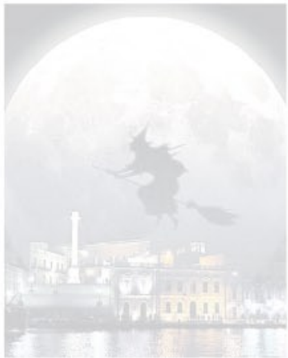
INIZIATIVA La notte bianca dei bambini arriva domenica in città

Domenica pomeriggio a Brindisi la festa avrà inizio alle 18.30. Fino a tarda sera il centro sarà un parco giochi sotto le stelle